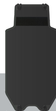
Large 1205 x 605mm 14.5kg