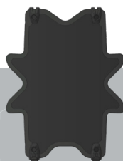
Tático - Pequeno 715 x 590 mm 7.2 kg